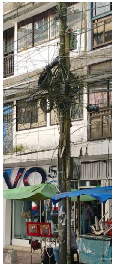
En este nudo de cables podría resumirse cómo es la comunicación entre las entidades y los humanos que deben velar porque las 'famosas' brechas en 'Tura' se vengzan, no en el tiempo, sino en las oportunidades.

La mafia sabe dónde se consigue, cómo se paga y cómo muere un plan. Quien le sirve solo no sabe responder porque no es su idea sino que solo se hizo para servir, pero no a su conciudadano, ni siquiera a su vecino que se gana otro escándalo en su cuadra.