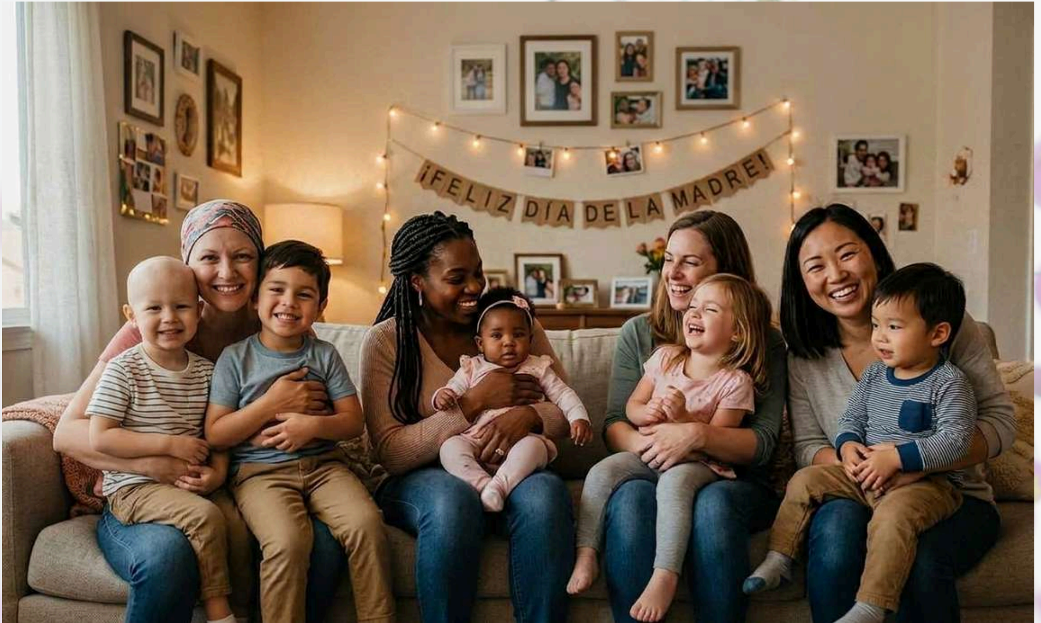
ELABORACIÓN CON AYUDA DE INTELIGENCIA ARTIFICIAL