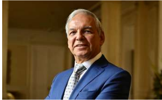
RICARDO BONILLA GONZÁLEZ / ARCHIVO