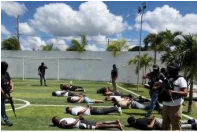
HAN CAIDO SEIS DE LOS OCHO MÁS BUSCADOS