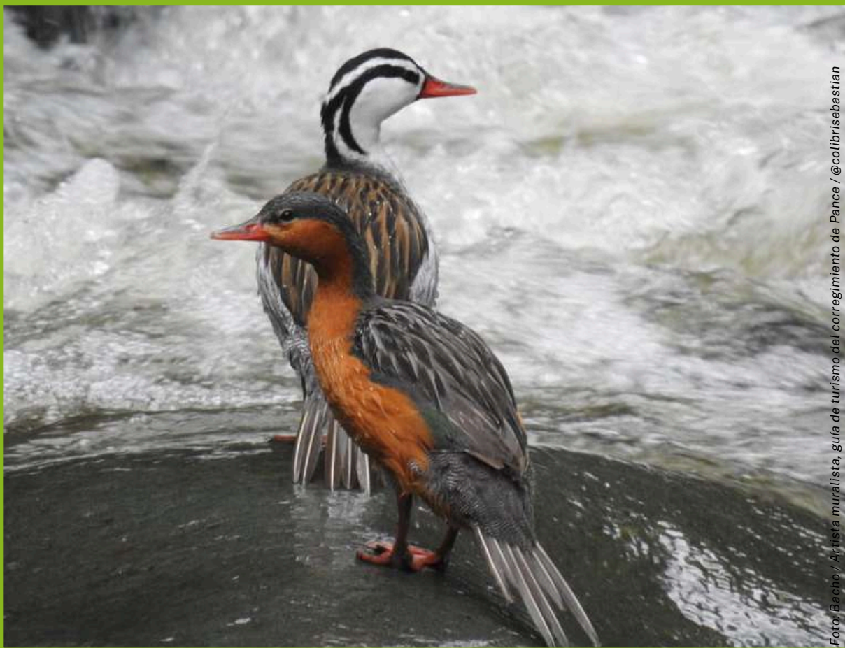
Foto: Bacho / Artista muralista, guía de turismo del corregimiento de Pance / @colibrisebastian