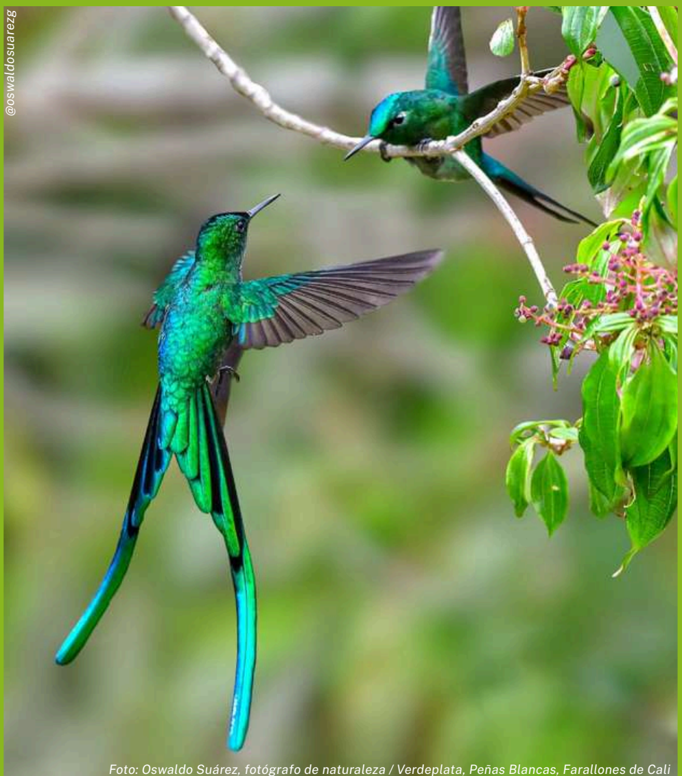
Foto: Oswaldo Suárez, fotógrafo de naturaleza / Verdeplata, Peñas Blancas, Farallones de Cali