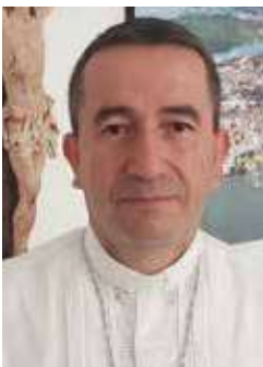
Por Monseñor Rubén Darío Jaramillo Montoya Obispo de Buenaventura

Los paradigmas que sostenían nuestras formas de pensar, valorar y relacionarnos han sido cuestionados y sustituidos por otros, creando en todos, sensaciones de inseguridad, inestabilidad, desorientación,