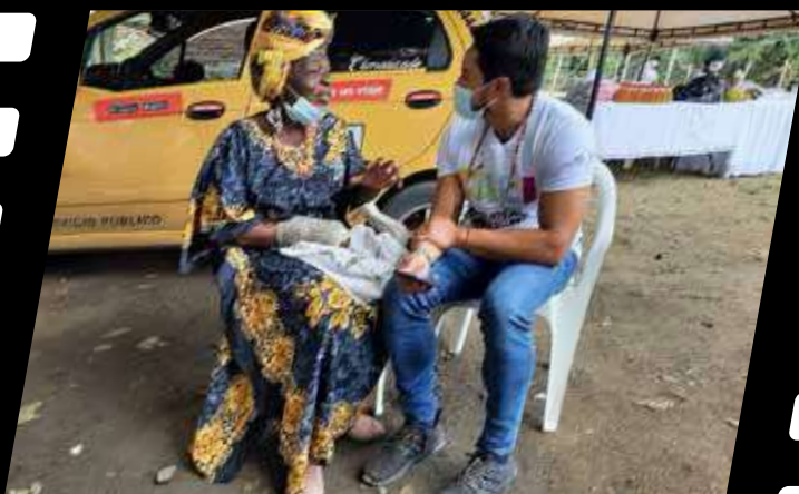
HABLANDO DE PETRONIO, el secretario de Cultura de Cali última detalles.