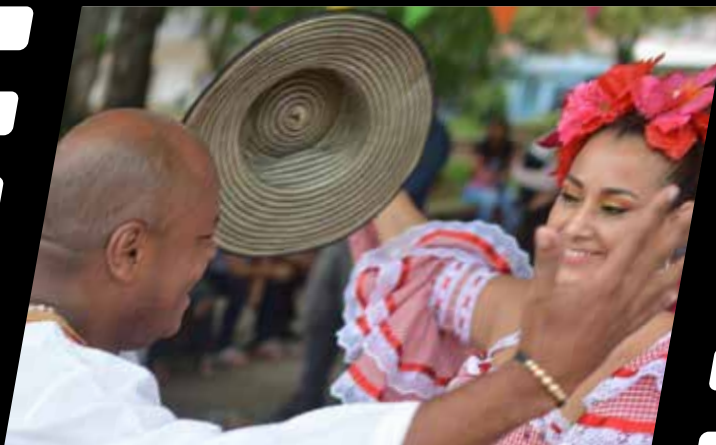
JAMUNDÍ celebra su temporada de festivales.

Por su parte, Buenaventura prepara la segunda versión del Festival de Arrullos del Pacífico (octubre 15 al 17) creado y organizado por Pacificarte, una puesta en escena que destaca la manera como sus habitantes saludan la vida y agradecen la ayuda espiritual divina. Es un evento que ofrece la identidad generada en el territorio y que se contradice con los alabaos en los que se ofrece, también, pero por reparación ante la pérdida.