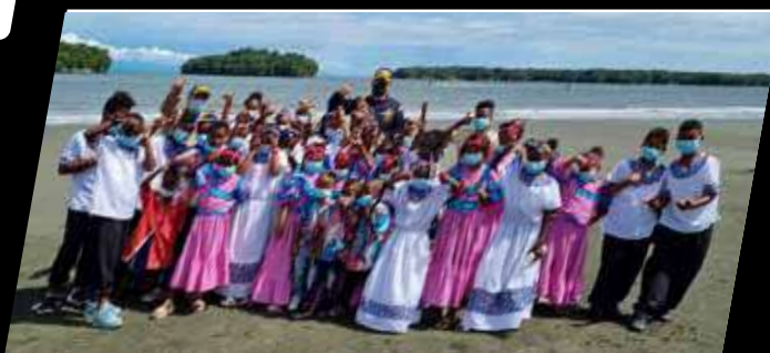
LAS YUBARTAS, el festival en Buenaventura y Juanchaco.