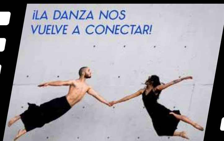
SE VIENE LA DANZA y el movimiento en Cali.