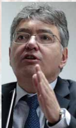
MAURICIO CÁRDENAS , ministro de hacienda.

Se incluyen 11,2 millones de propietarios de vehículos a los que en $135 se incrementará el galón de gasolina; los consumidores de gaseosa, té, jugos y energizantes azucarados $300 por cada litro; los fumadores $2.100 por cada cajetilla y los que com-