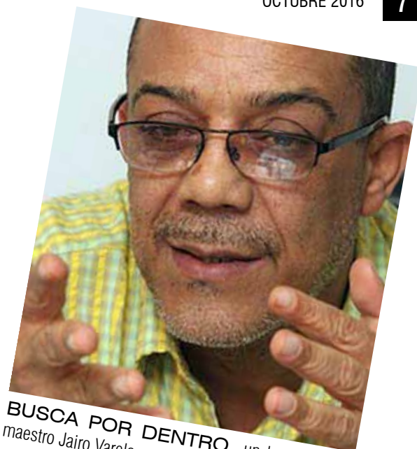
BUSCA POR DENTRO, un homenaje al maestro Jairo Varela.