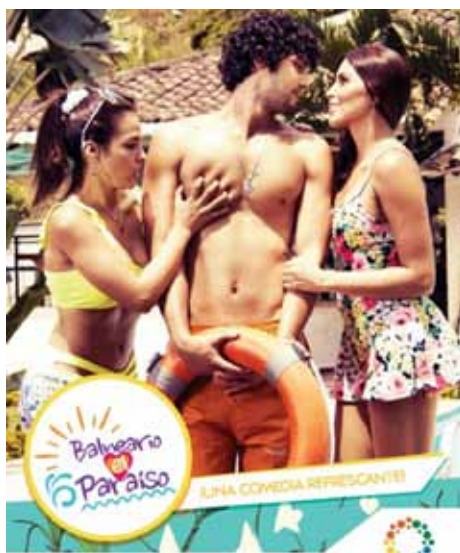
UNA DE LAS PRIMERAS series producidas por TELEPACÍFICO.