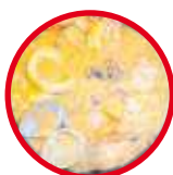
Cazuela de mariscos

ATENDEMOS TODO TIPO DE EVENTOS Y REUNIONES CORPORATIVAS CON PROTOCOLO DE BIOSEGURIDAD