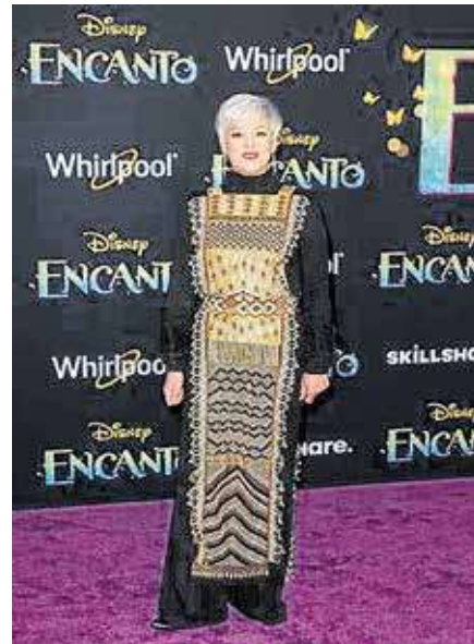
MARÍA CECILIA BOTERO, en la premiere de 'Encanto'.

de Encanto: "nos olvidamos de lo que somos, de lo que tenemos, y hoy Disney viene a decírnoslo y a mostrárnoslo".