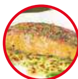
Filete de pescado en salsa de coco