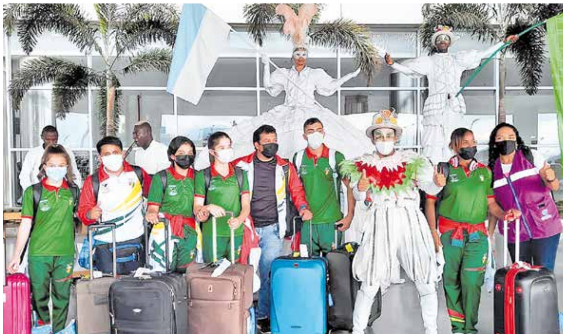
EN LA FOTO de Casa Naranja se aprecia la alegría con que han sido recibidas las delegaciones de los I Juegos Junior 2021.

La boletería para el ingreso a los escenarios podrá comprarse a través de www.viveboletos.com y presencial en las subsedes o centros comerciales Holguines Trade Center, Pacific Centro Comercial, Palmetto y Único o en los contenedores dispuestos en el Panamericano, cerca de las piscinas Botero O'Byrne, en el Coliseo El Pueblo o ciudadelas deportivas de Palmira, Buga y Jamundí. Informes en call center (602) 3900195.