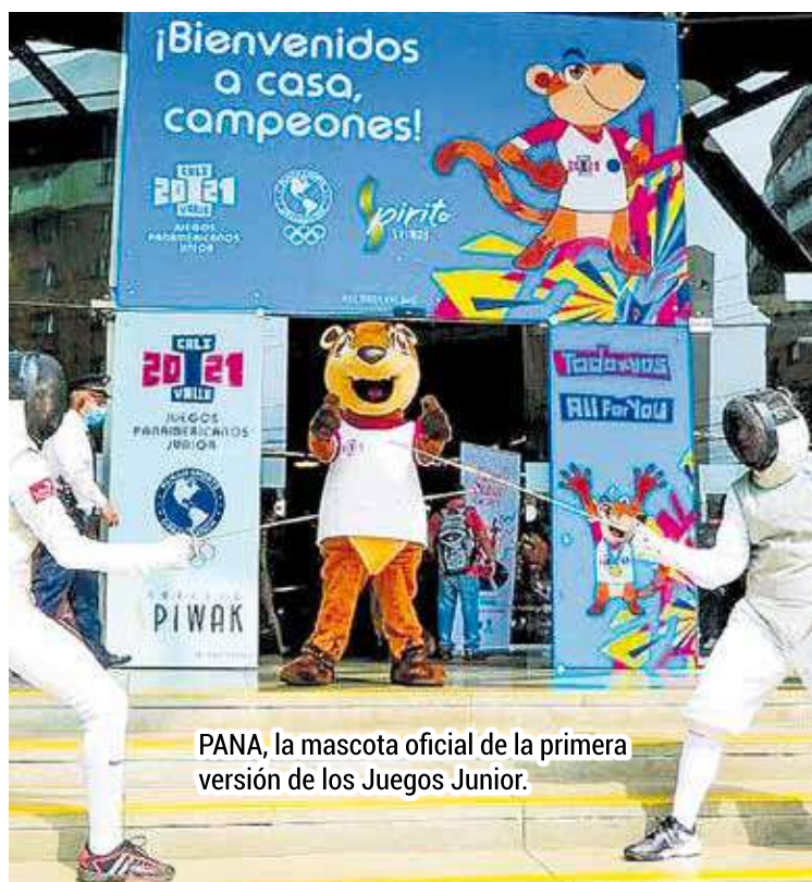
PANA, la mascota oficial de la primera versión de los Juegos Junior.