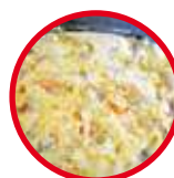
Fricasé de Pollo