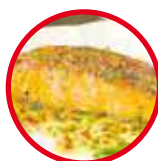
Filete de pescado en salsa de coco