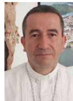
Por RUBÉN DARÍO JARAMILLO MONTOYA Obispo de Buenaventura