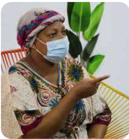
Foto: Marisol Congolino en el lanzamiento nacional #BuenaventuraSuenA

Recientemente se realizó la socialización nacional, regional y local de este proceso de desarrollo e implementación de Buenaventura Cómo Vamos, Marea Digital y DeliberaTura, tres herramientas que buscan promover y fortalecer la participación ciudadana, la gestión pública y la democracia.