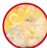
Cazuela de mariscos

ATENDEMOS TODO TIPO DE EVENTOS Y REUNIONES CORPORATIVAS CON PROTOCOLO DE BIOSEGURIDAD