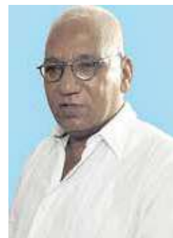
Por FABIO LARRAHONDO VIÁFARA. @falavi2005