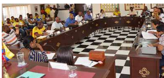
CONCEJO DE BUENAVENTURA aprobó presupuesto para la vigencia 2018 por 551 mil millones de pesos.

además, que el 77 por ciento de los gastos se realizará en las áreas de salud y educación. El proyecto de presupuesto