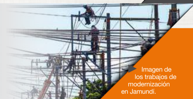
Imagen de los trabajos de modernización en Jamundí.

Dónde: Nayita, Calimita, el centro (incluido el Boulevard y la zona logística), Pueblo Nuevo, Centenario, Santander, La zona del Puente El Piñal y Pascual Andagoya