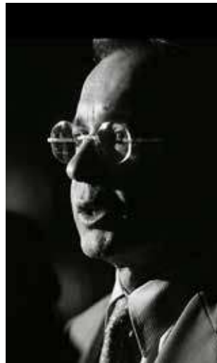
Álvaro Uribe Vélez

Como se mueven las fichas, la posibilidad de una sábana de tarjetón se simplifica y en marzo el elector no encontraría un tarjetón de partidos, sino de coaliciones que van la de la izquierda, a la derecha y al del centro, con miras a encontrar los candidatos a la presidencia de la República.