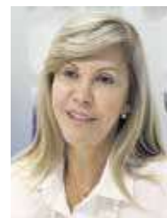
Dilian Francisca Toro T.

La exgobernadora Toro Torres confirmó que la gestión para desarrollar este proyecto para el Pacífico se hizo durante su administración promoviendo y trabajando decididamente con el gobierno Nacional para que se construya en Buenaventura.