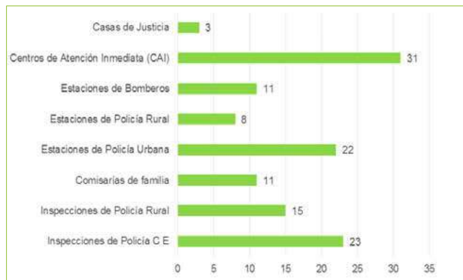
Figura 1. Consolidación de infraestructura en Seguridad (Cali en cifras 2019)