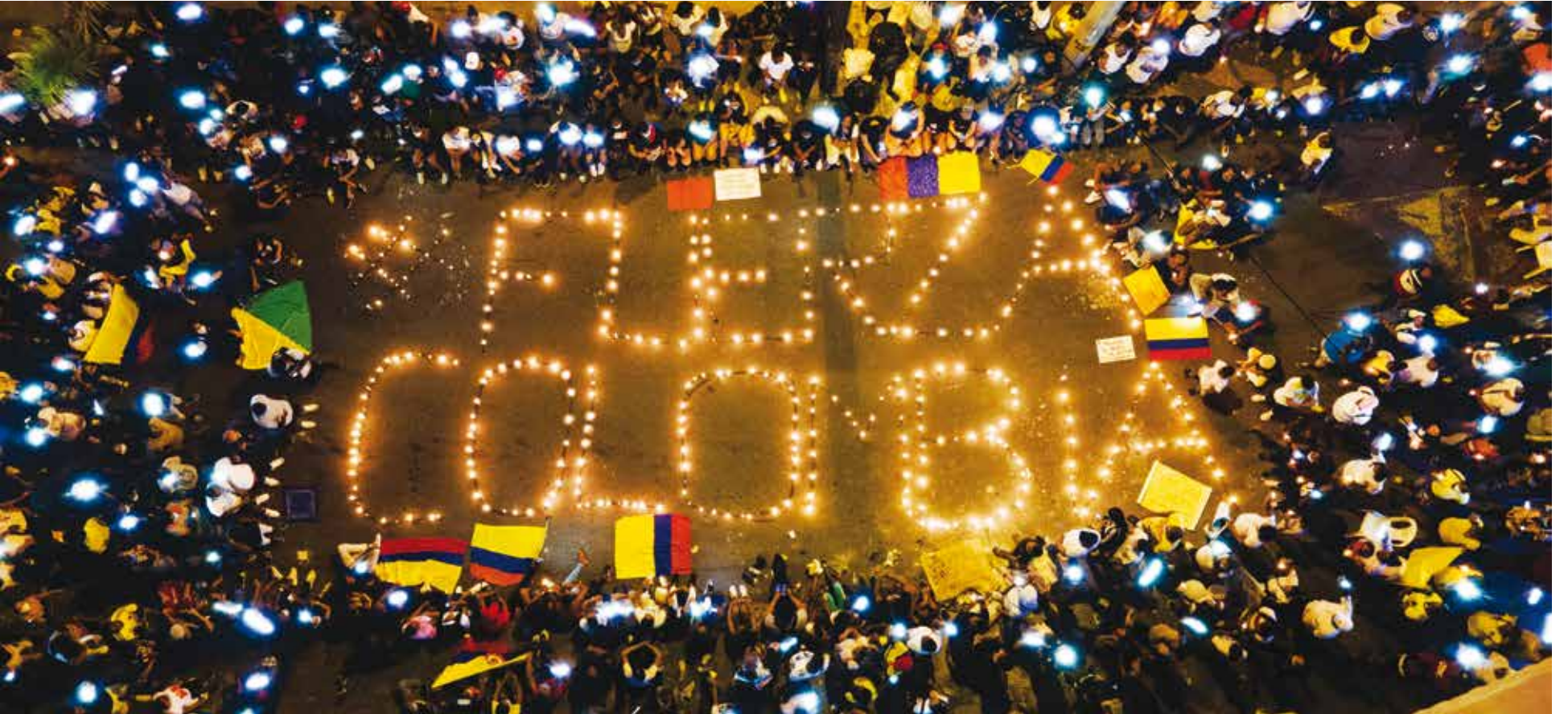
COLECTIVO DE JÓVENES AGRUPADOS POR REDES ante la 'furia' con la que se atacó la resistencia en Cali. Velatón por la vida y en memoria de los muertos en las protestas y manifestaciones del Paro Nacional que busca cambios en la reforma tributaria y en la manera de gobernar. 500 personas de Buenaventura con 200 velas enviaron este mensaje al mundo. #EnergíaYResistencia #Resistencia #Sabrosuras #FuerzaColombia.