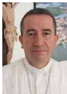
MONSEÑOR RUBÉN DARÍO JARAMILLO MONTOYA Obispo de Buenaventura

Para muchas personas es una mesa de negociación, pero hay que aclarar que, en este momento, mientras no haya un marco jurídico que lo respalde, no se puede hablar de una mesa (término utilizado solo para las conversaciones entre el gobierno nacional y los grupos rebeldes con ideologías políticas). Aquí se instaló fue un "espacio sociojurídico" para escuchar, construir soluciones a las problemáticas de los sectores, definir una o unas rutas de intervención, definir prioridades, estimular el compromiso de los portuarios, comerciantes, medios de comunicación, fuerza públi-