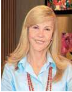
DILIAN FRANCISCA TORO T. Presidenta del Partido de la U

La vida de los bonaverenses no puede continuar a merced de la delincuencia y sufriendo el horror de la violencia en sus calles, tal como se ha visto con