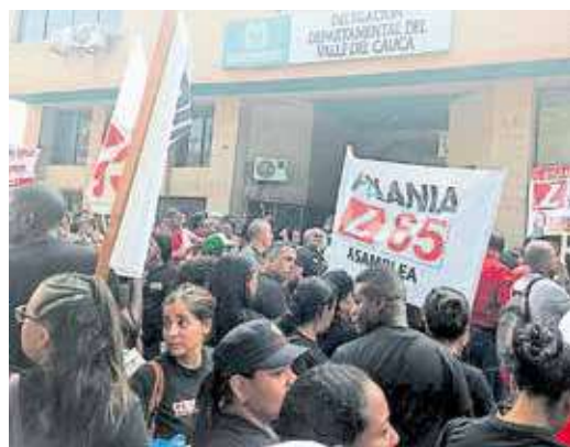
LA REGISTRADURÍA de los Cámbulos, al sur de Cali, estuvo a reventar cada día de los últimos instantes de las inscripciones a las elecciones de octubre 27 de 2019.