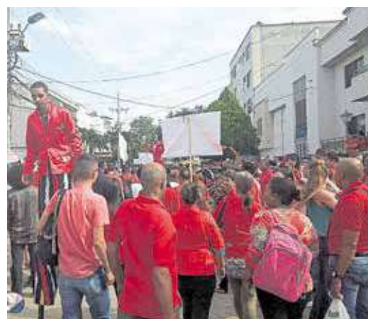
ASÍ COMO ANDAN es común que se siga viendo en las calles de los municipios a simpatizantes de los diferentes candidatos a Gobernación, Alcaldía, Asamblea, Concejo y Juntas Administradoras Locales.