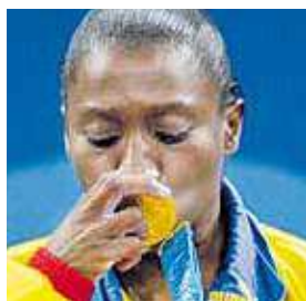
María Isabel Urrutia