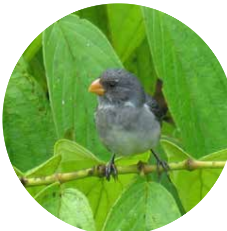
Espiguero Gris ( Sporophila intermedia )