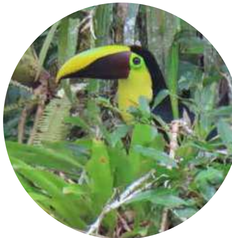
Tucán guarumero ( Ramphastos ambiguus )