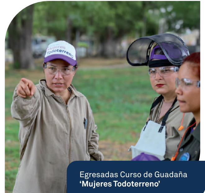
Egresadas Curso de Guaduaña 'Mujeres Todoterreno'

Esta estrategia busca formar mujeres para las obras de construcción, reduciendo las brechas de género en los territorios, fortaleciendo la economía de la zona y potenciar la empleabilidad y el empoderamiento femenino.