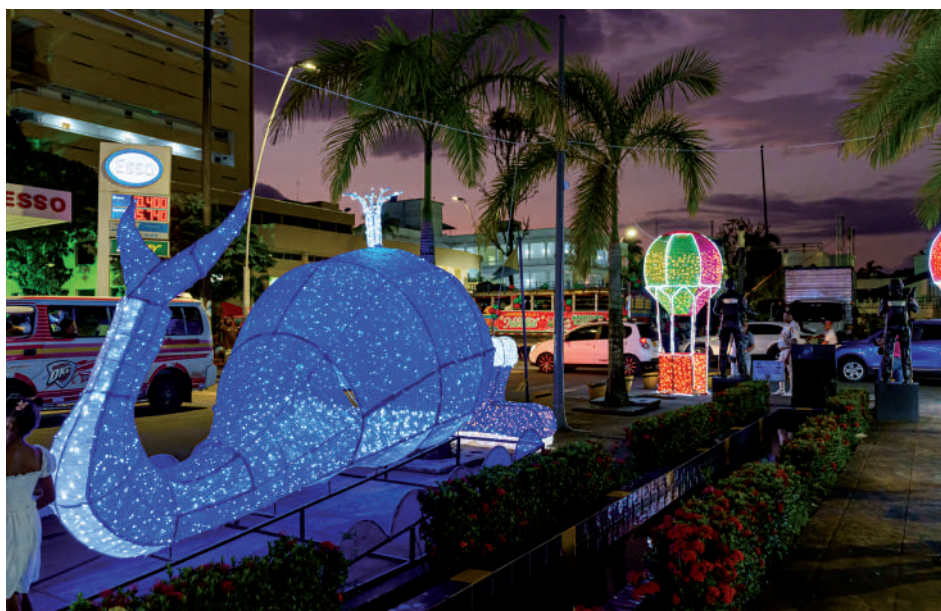
PORTEÑO, SE NOTA

Un espectáculo de luces y formas que hacen referencia al mar y con el apoyo de la Sociedad Portuaria Regional de Buenaventura se disfruta por el malecón Bahía de la Cruz, el Bulevar y otras áreas aledañas.