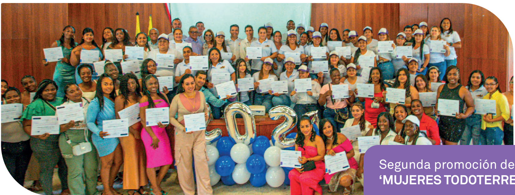
Segunda promoción de 'MUJERES TODOTERRENO'

En esta segunda promoción de MUJERES TODOTERRENO , se certificaron en: Soldadura, Controlador de Trafico, Operación de Retroexcavadora, Operación de Minicargador, Técnica en Construcción de Vías, Curso Construcción de pavimentos con Placa Huellas, Electricidad Básica, Construcción de Estructuras Básicas y Artesanías en Guadua transformando la vida de las comunidades de los siete municipios del área de influencia del proyecto vial: Buga, Yotoco, Restrepo, Calima (Darién), Dagua, La Cumbre y Buenaventura.