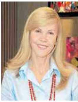
DILIAN FRANCISCA TORO T. Presidenta del Partido de la U

Uno de los grandes desafíos que tiene el país es el de generar políticas para que cada vez más colombianos puedan acceder a una vivienda digna. Se trata de una tarea a todas luces titánica. Según el Dane, en 2021 el 31% de los hogares colombianos presentaron déficit habitacional, es decir que en Colombia hay un faltante de 5,24 millones de viviendas.