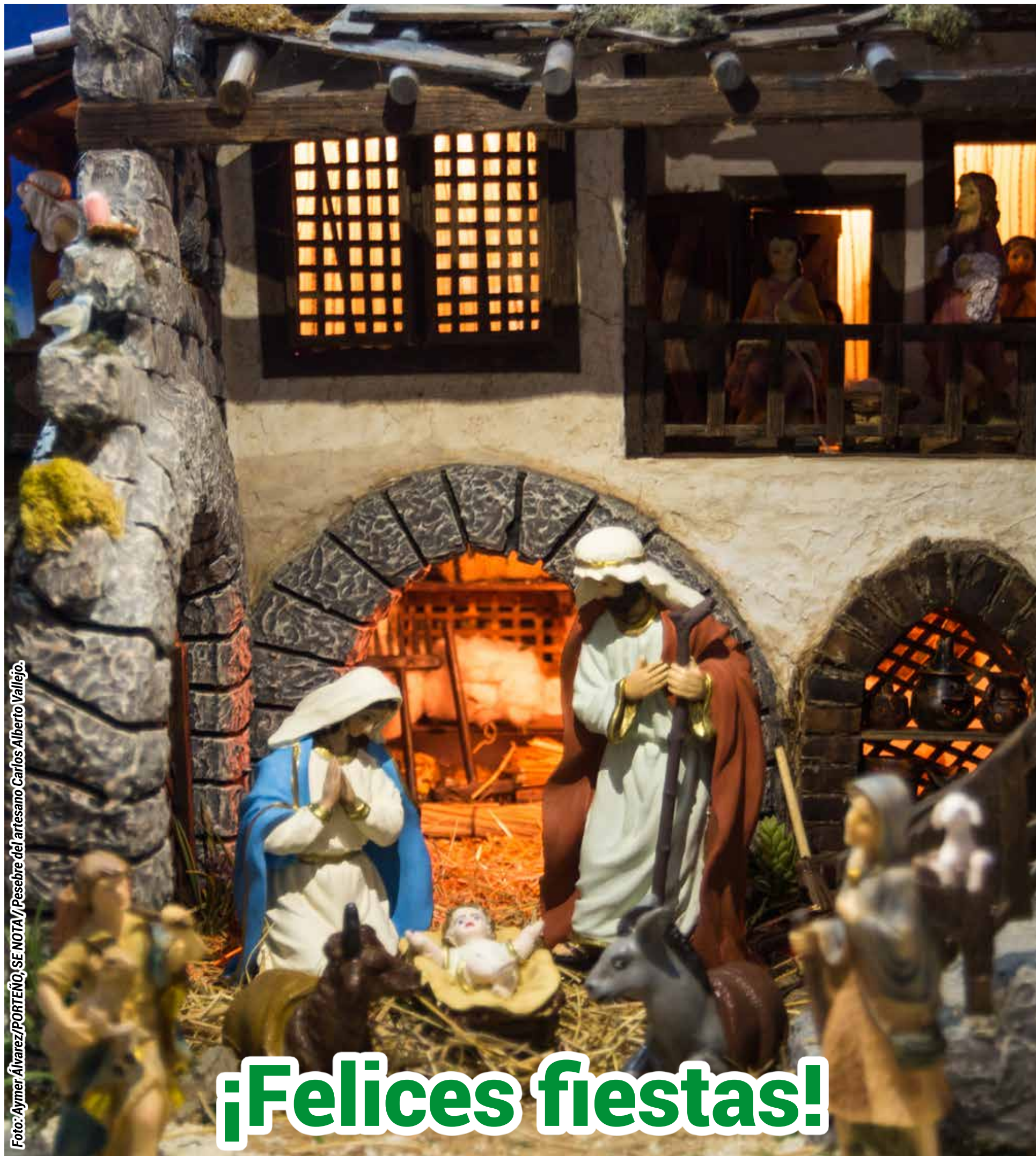
Pesebre del artesano Carlos Alberto Vallejo.

PUBLICACIÓN DESDE 2015 - Pacífico Año VI / Edición 46 - ISSN - 2462-9723