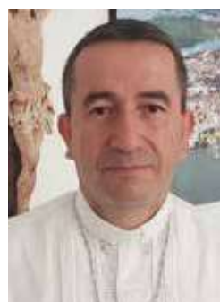
MONSEÑOR RUBÉN DARÍO JARAMILLO MONTOYA Obispo de Buenaventura

Por otro lado, tenemos sufrimientos y dolores. Para Buenaventura no puede pasar de largo el acontecimiento de la desaparición de nuestros hermanos del Yurumanguí, la situación difícil por la que están pasando los comerciantes desesperados por la extorsión y los robos, sumado a un tiempo prolongado de crisis por la pandemia y los paros. Que no se asesine a ninguna