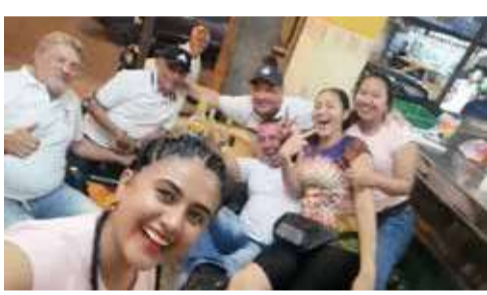
LOS TONELES, el café más dinámico de Buenaventura, donde las noticias corren de boca en boca, se usa el celular para contactar y no para chatear, es una de las esquinas más emblemáticas de la ciudad. Desde allí se han divisado las más grandes carretas con frutas, los carros más extraños y las féminas más atractivas de la ciudad que pasean por pleno centro bonaverense. Aunque algunos le han bautizado como la casa de los retirados y pensionados, el movimiento interior de negocios y secretos de Estado se han pasado bajo un rico café. En diciembre todos esperan la ansiada despedida del año para los clientes abonados que hayan consumido más de 1.000 tazas de tinto.