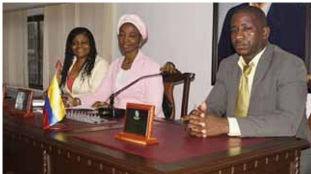
LA JUNTA DIRECTIVA de 2016, presenta un buen balance para el ejecutivo.