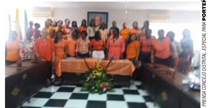
EL DÍA NARANJA desde el Concejo apoyó el No Maltrato a la Mujer.