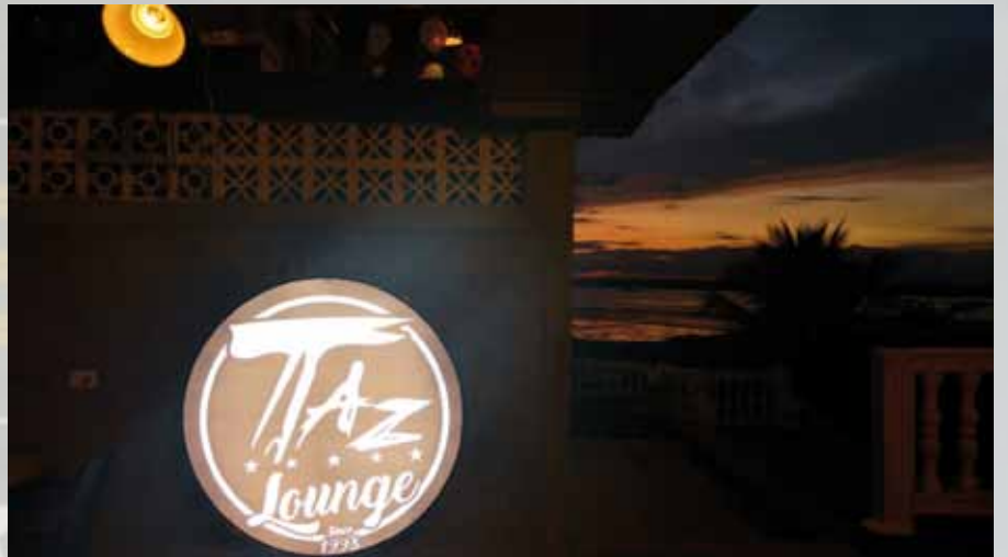
EN LA NOCHE