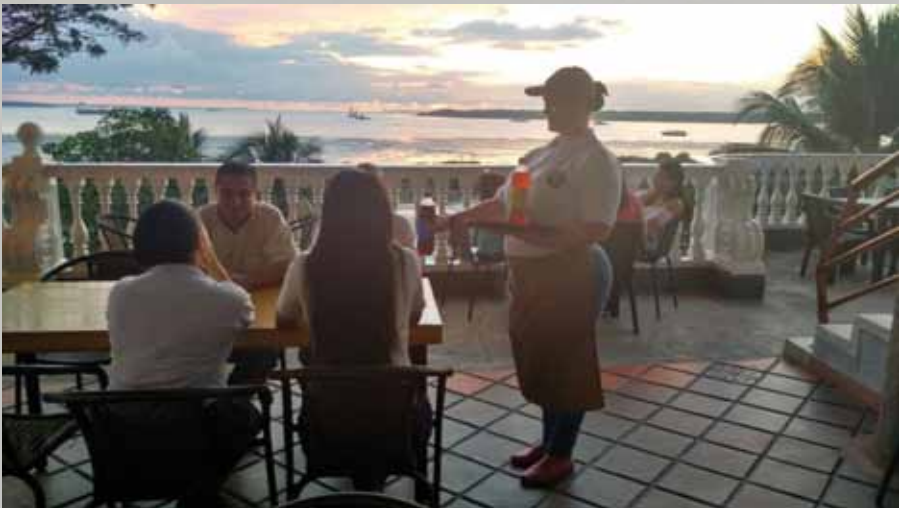
EN EL DÍA