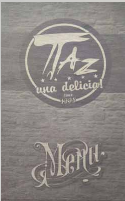
TODO EL MENÚ...