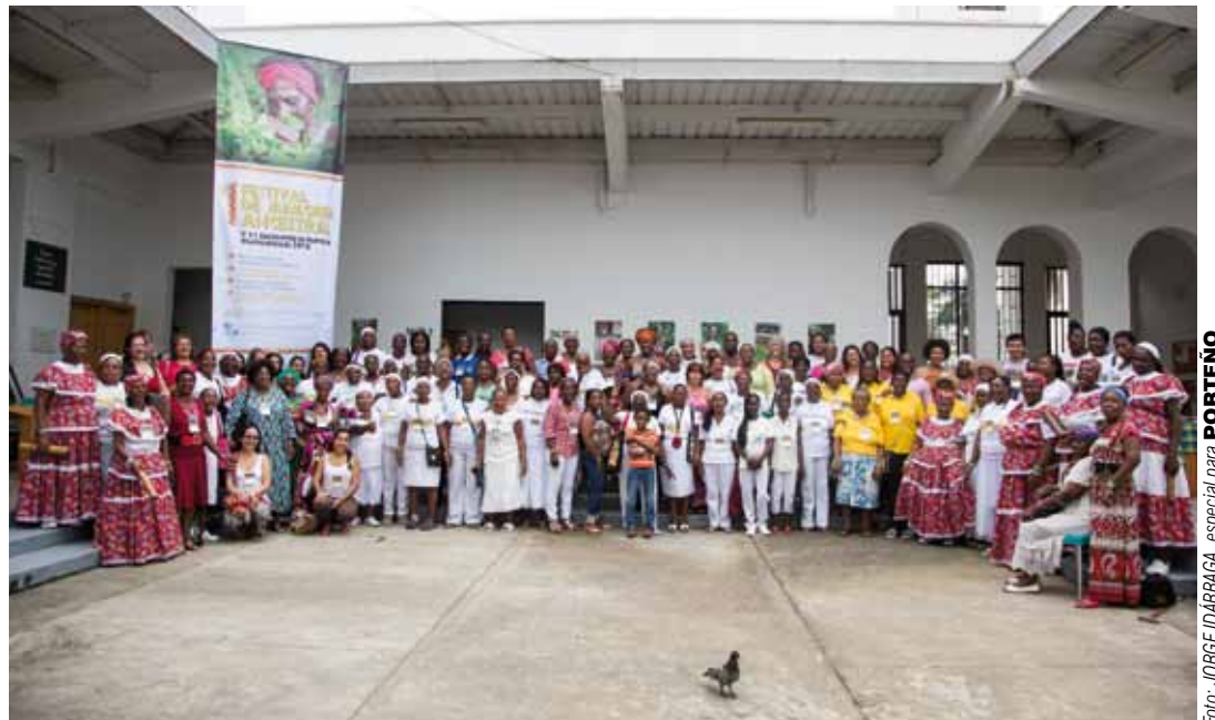
LAS PARTERAS DEL PACÍFICO se constituyen en Patrimonio Cultural Inmaterial de Colombia. Ahora se busca que se incluyan dentro del Sistema de Salud.

Surgió de la necesidad manifestada por la comunidad de parteras afro del Pacífico de generar una herramienta que permitiera la salvaguardia integral de la partería tradicio-