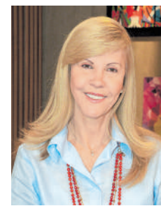
DILIAN FRANCISCA TORO T. Presidenta del Partido de la U