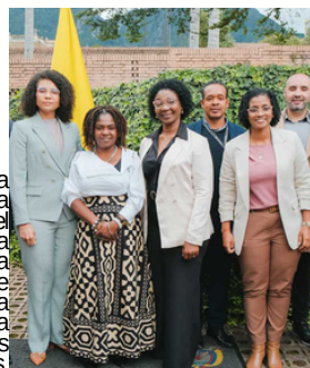
La vicepresidenta Francia Márquez, la gobernadora del Chocó, Nubia Carolina Córdoba y la alcaldesa de Buenaventura, Ligia del Carmen Córdoba, y asesores territoriales.

La Vicepresidencia, junto a Planeación Nacional y el Ministerio de Hacienda, realizarán entre mayo y junio cuatro encuentros regionales con alcaldes y organizaciones sociales, de los cuatro departamentos del Pacífico, con el fin de socializar los avances y fortalecer la construcción colectiva de la Política. Estos espacios serán escenarios de diálogo, escucha y participación activa de las comunidades.